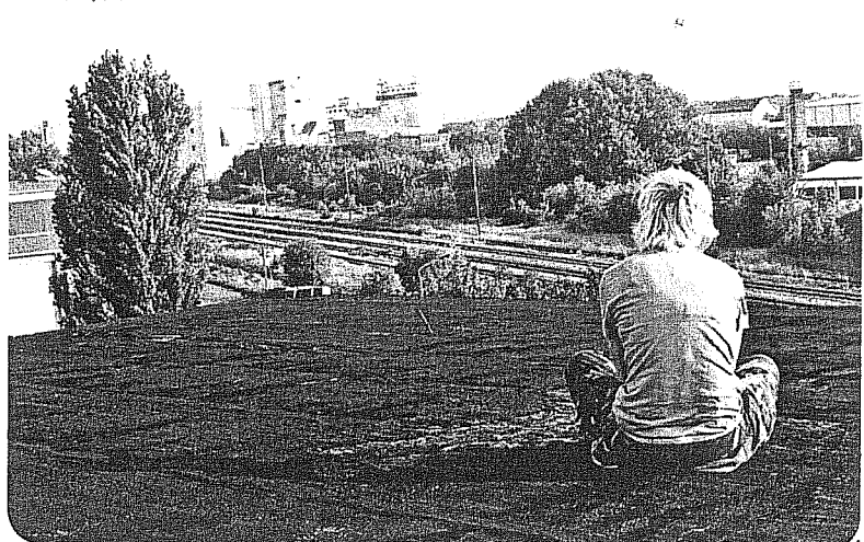
Creepy White Rabbit

Helemaal matcht het GKRb-verhaal niet met de realiteit.